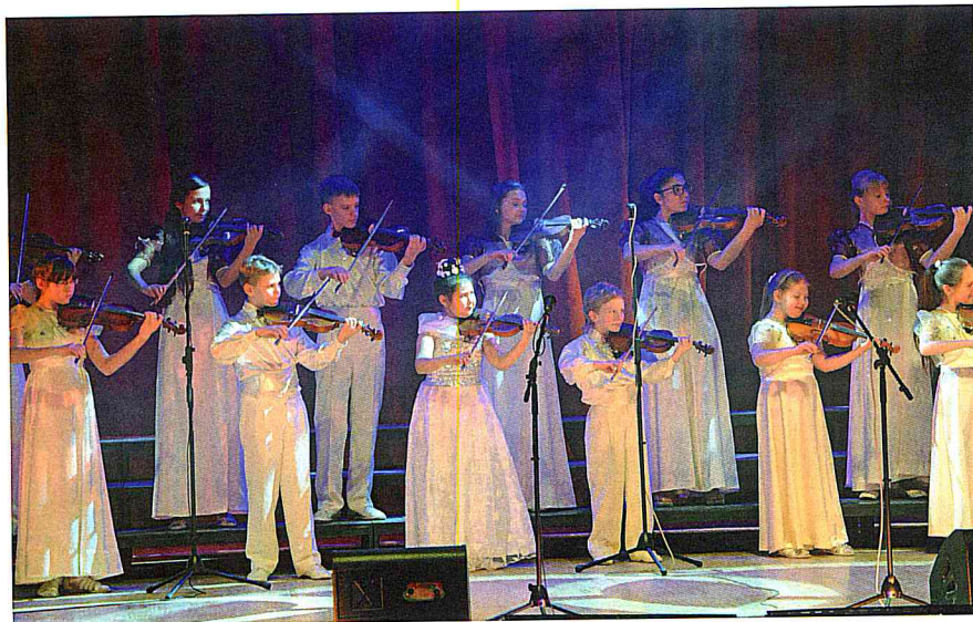
Играет Ансамбль скрипачей.