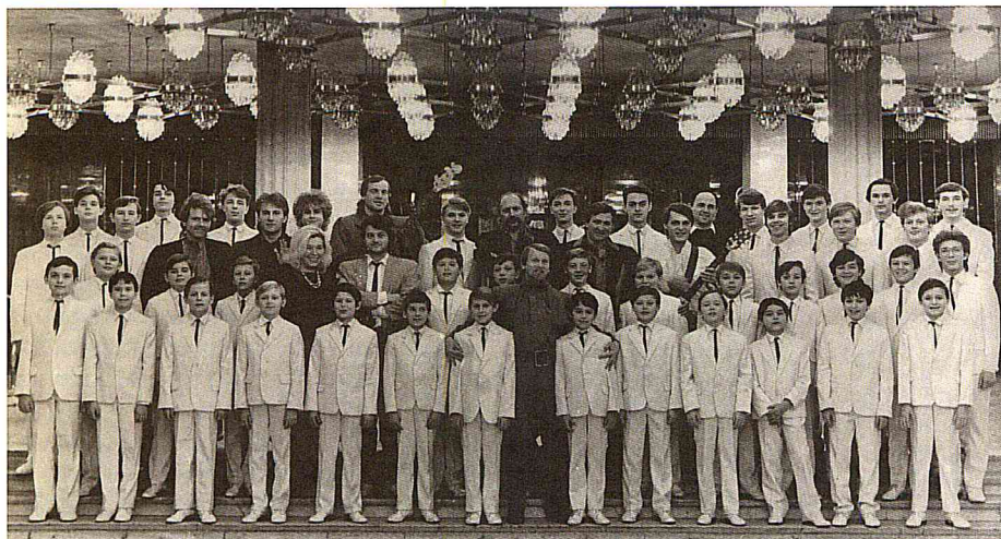
Капелла мальчиков и юношей – участник концерта, посвящённого 70-летию Октябрьской революции. Концертный зал «Россия». Москва. 1987.

детьми надо заниматься, что они не воспитываются сами по себе. В Свердловске всегда было, куда пойти: музеи, театры, выставочные залы. Не хватало солидной площадки для детского творчества. Первые наши наборы – очень разные мальчики-девочки. И даже хулиганы. В то время «сложный» ребёнок считался задачей для всех. Мы прививали понимание того, что, попав в коллектив, человек, даже маленький, обязан подчиняться его законам. Музыка – это не только цветы и аплодисменты. Они привыкали к тому, что надо трудиться и трудиться по-настоящему. Это становилось нормой жизни», – вспоминает заслуженный артист России Юрий Бондарь, работающий в Детской филармонии со дня её основания – сначала хормейстером Капеллы, потом её главным дирижёром, художественным руководителем всей филармонии.