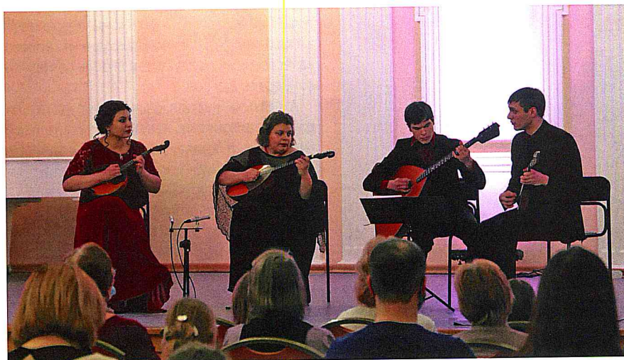
Квартет «13 струн».