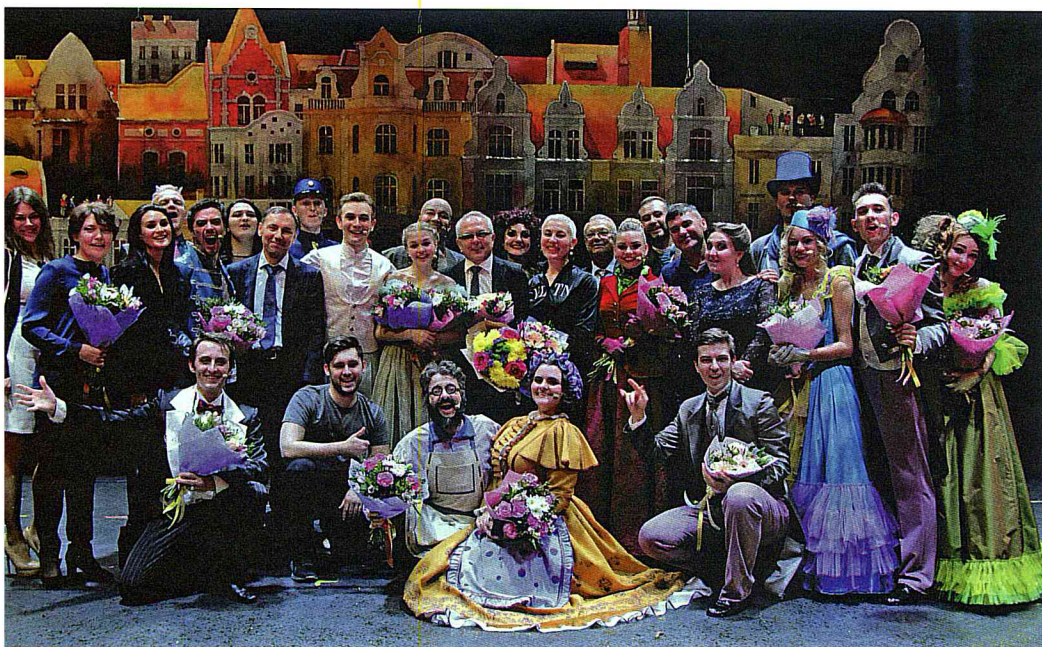
После премьеры мюзикла К. Брейтбурга «Парижские тайны».