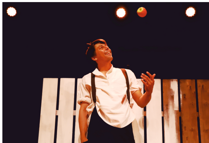
Приключения Тома Сойера