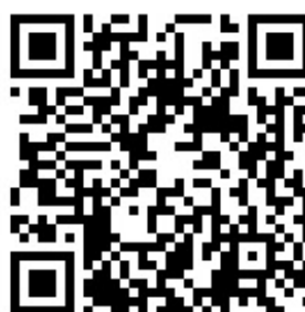
Концерт «Победный хор»