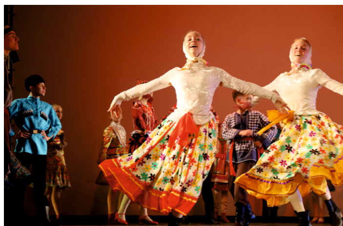
Легенды земли уральской