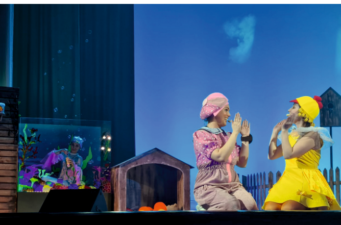
Большое сердце маленького Хрю