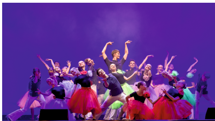
Танцы? Танцы! Танцы...