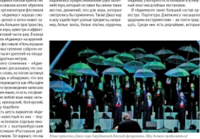
Муниципальный ансамбль в Перми