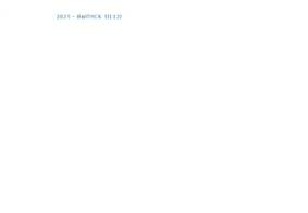
Муниципальный ансамбль в Перми