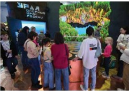
Посетители стенда Свердловской области