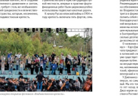
Муниципальный ансамбль в Перми