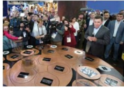
Губернатор Евгений Куйвашев в презентации выставки проекта региона