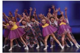
Ансамбль танца «Ульяны» Свердловской филармонии

В День Свердловской области выступили и наши творческие коллективы. Свои концертные программы дали струнный «Исетьюский квартет» Свердловской филармонии, ансамбль «Измурду» и солисты театра мюзикомедии, артисты Уральского государственного театра эстрады.