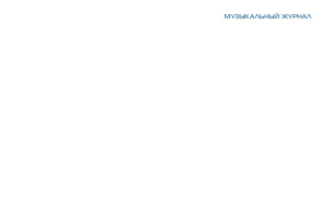
Муниципальный ансамбль в Перми

Муниципальный ансамбль в Перми исполнил классический мюзикл Фетисова «Волшебная скрипка», традиционное русское танцевальное шоу «Славянский вальс» и концерт «Славянский вальс».