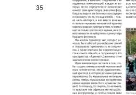
Муниципальный ансамбль в Перми